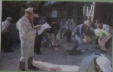
交流会 (竹炭の着火競争)