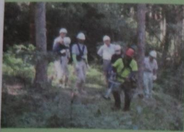
森づくり研修会 (刈払機の安全な取扱い)