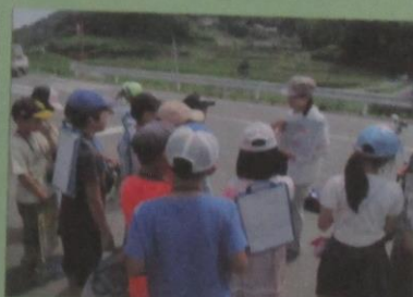
森づくりサポーターの派遣 (野鳥の観察)