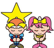
岡山県マスコット ももっち・うらっち