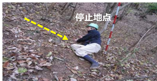
滑落が止まった地点