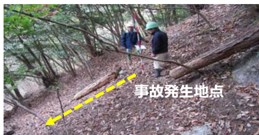
事故発生地点（ポール）