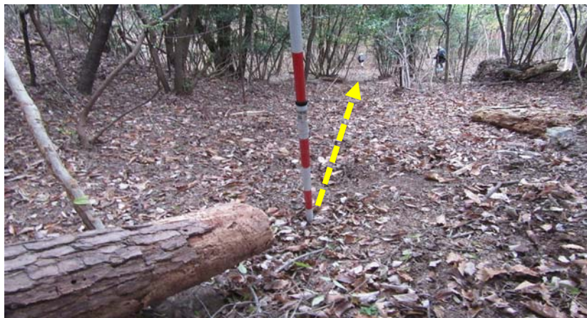
事故発生地点（ポール）から下方へ