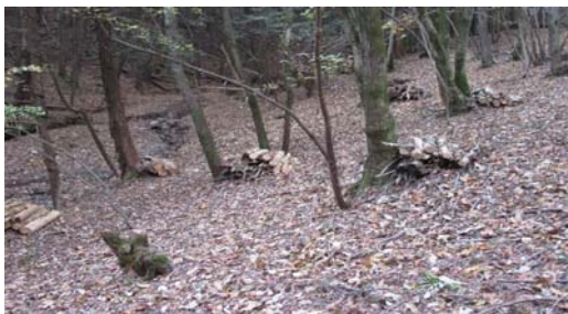
当日の活動内容（集積処理）