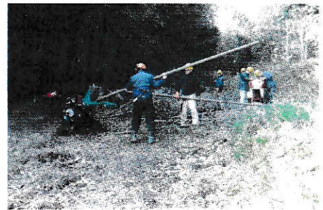
昨年の作業の様子

日程 : 9:30 ~ 現地集合・受付 10:00 ~ 開会 10:05 ~ 作業等説明 10:20 ~ 竹林整備・遊歩道の整備 12:00 ~ 昼食 13:00 ~ 竹林整備(栗植樹地の下刈) 14:00 ~ 片付け 14:30 ~ 閉会・解散