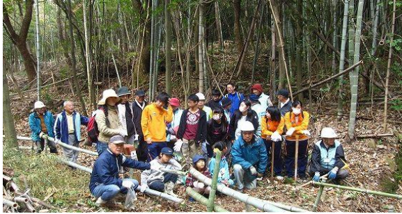
操山森づくり活動の様子

操山は四方を川と市街地に囲まれた独立した山として岡山市民の貴重な自然空間です とみやまエコクラブでは、操山東部を中心に市民の憩いの場をめざして整備を進めています